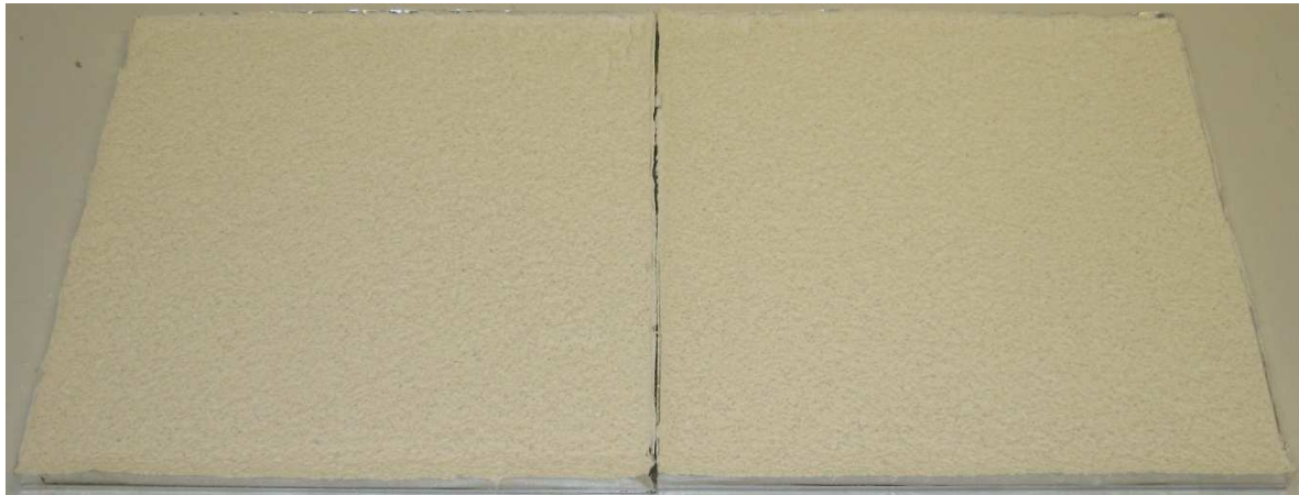
A002: multiContact MC 55 W