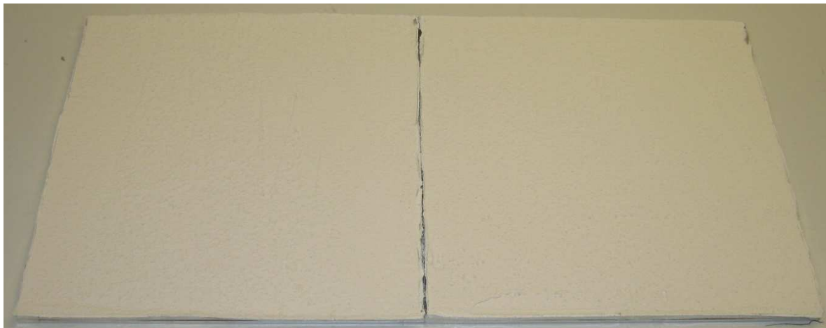
A006: Baumit Glätt 17 L